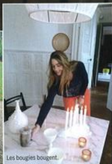
Les bougies bougent.