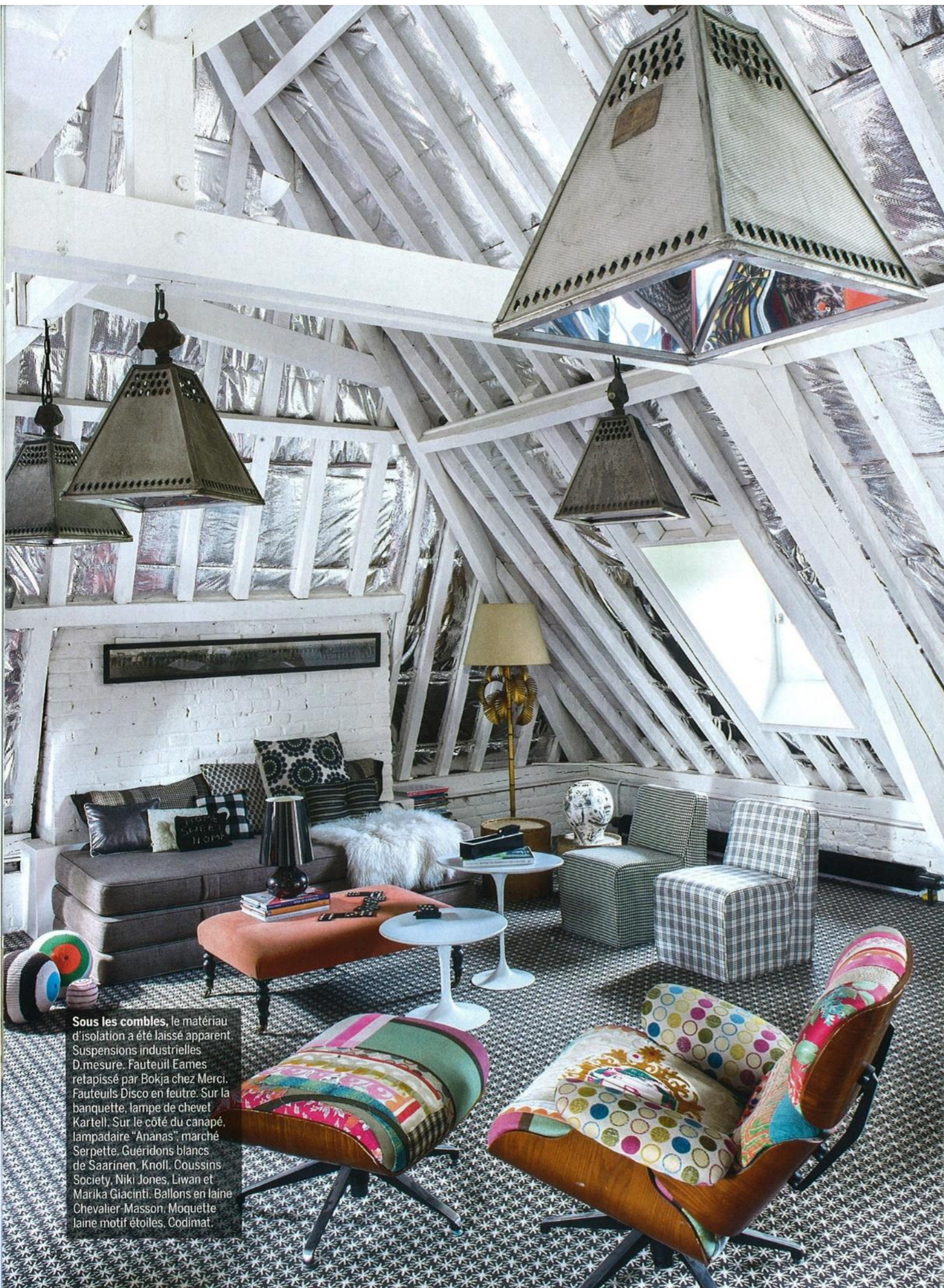
Sous les combles, le matériau d'isolation a été laissé apparent. Suspensions industrielles D. mesure. Fauteuil Eames retapissé par Bokja chez Merci. Fauteuil Disco en feutre. Sur la banquette, lampe de chevet Kartell. Sur le côté du canapé, lampadaire "Ananas", marché Serpette. Guéridons blancs de Saarinen, Knoll. Coussins Society, Niki Jones, Liwan et Marika Giacinti. Ballons en laine Chevalier-Masson. Moquette laine motif étoiles, Codimat.