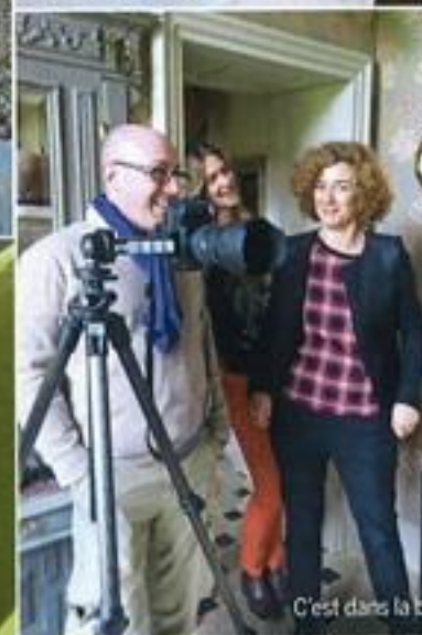
C'est dans la boîte !