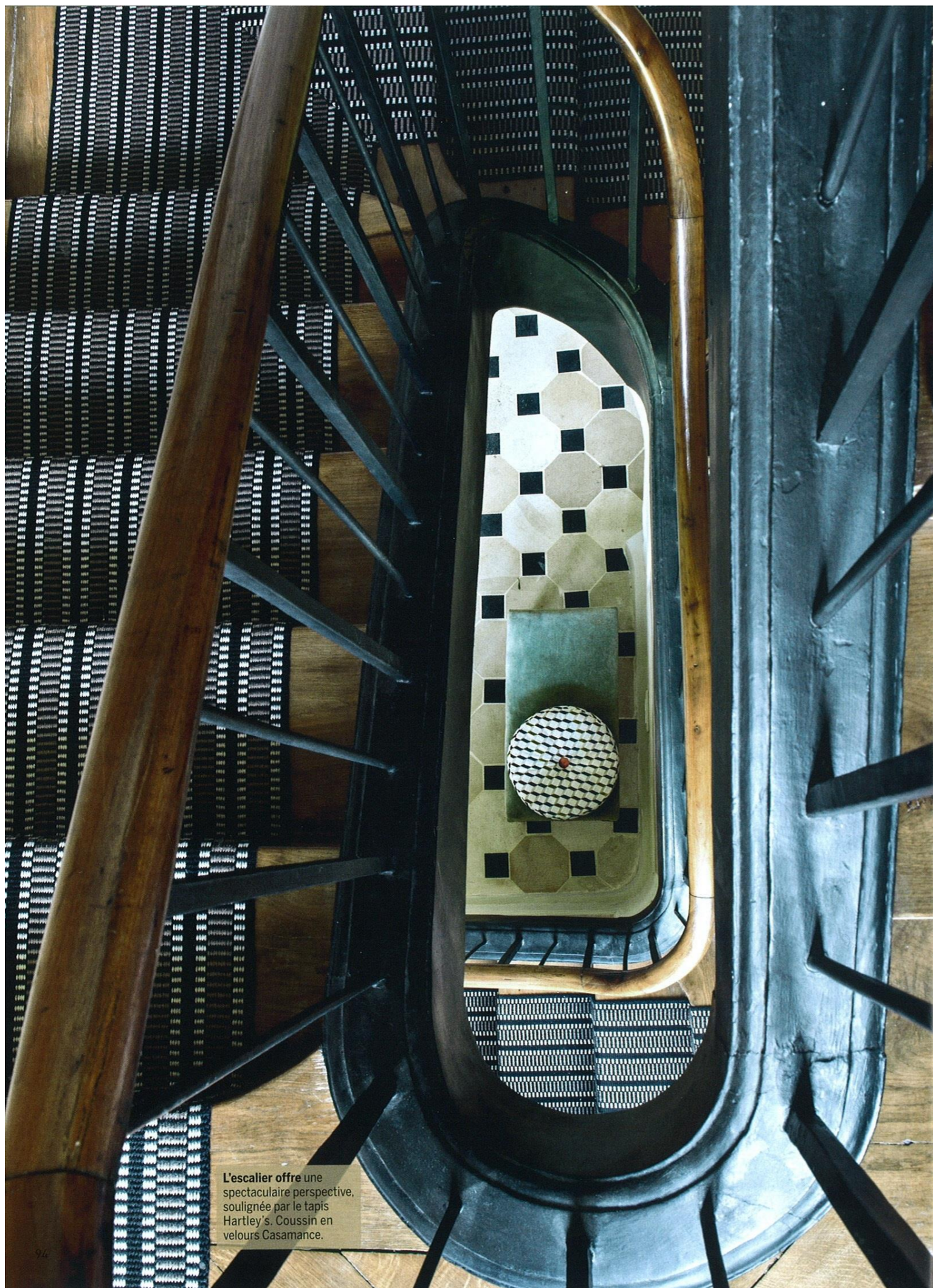
L'escalier offre une spectaculaire perspective, soulignée par le tapis Hartley's. Coussin en velours Casamance.