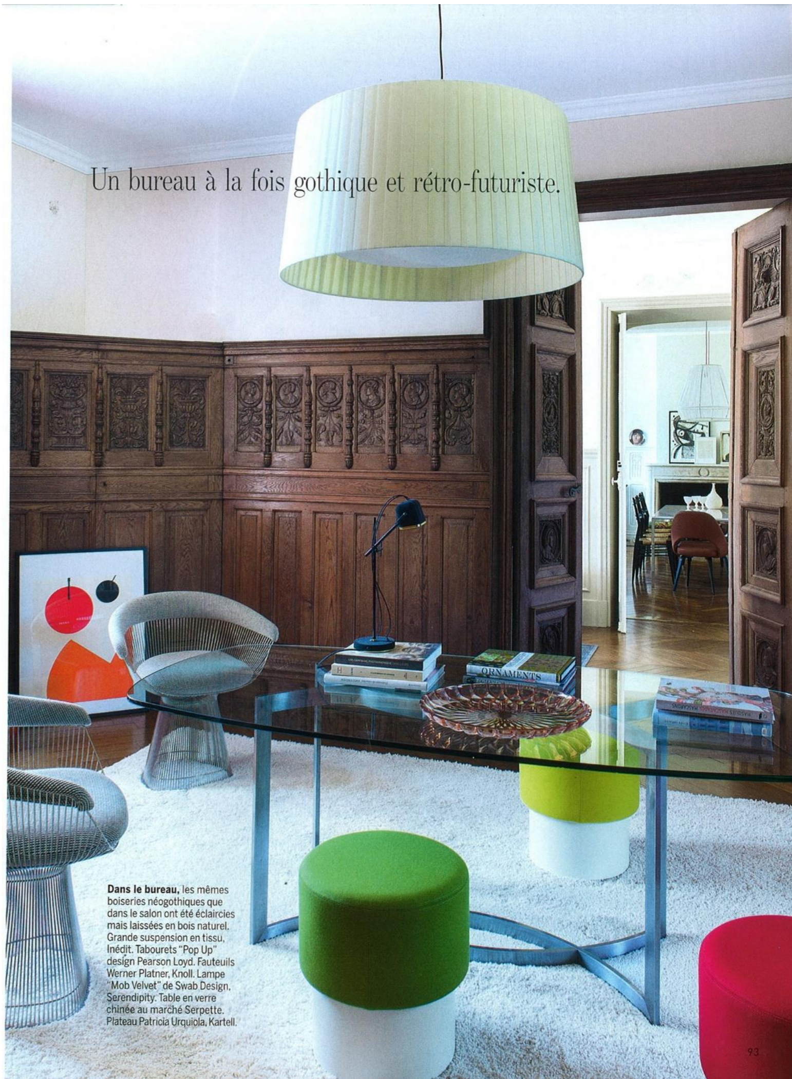
Un bureau à la fois gothique et rétro-futuriste.