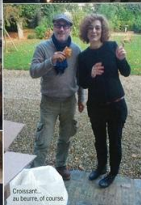
Croissant... au beurre, of course.